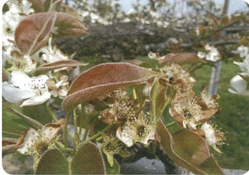
霜により変色したナシの花

4月15日早朝、気温が氷点下となり、共済組合独自で行っている気温観測地点では午前5時以降に南部町でマイナス3.8度、八頭町でマイナス3.0度を記録しました。