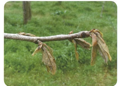
霜により枯死したカキの葉