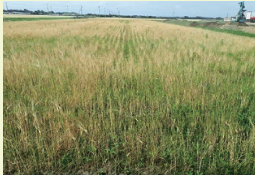
湿害による生育不良