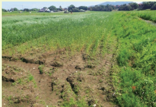
湿害による生育不良